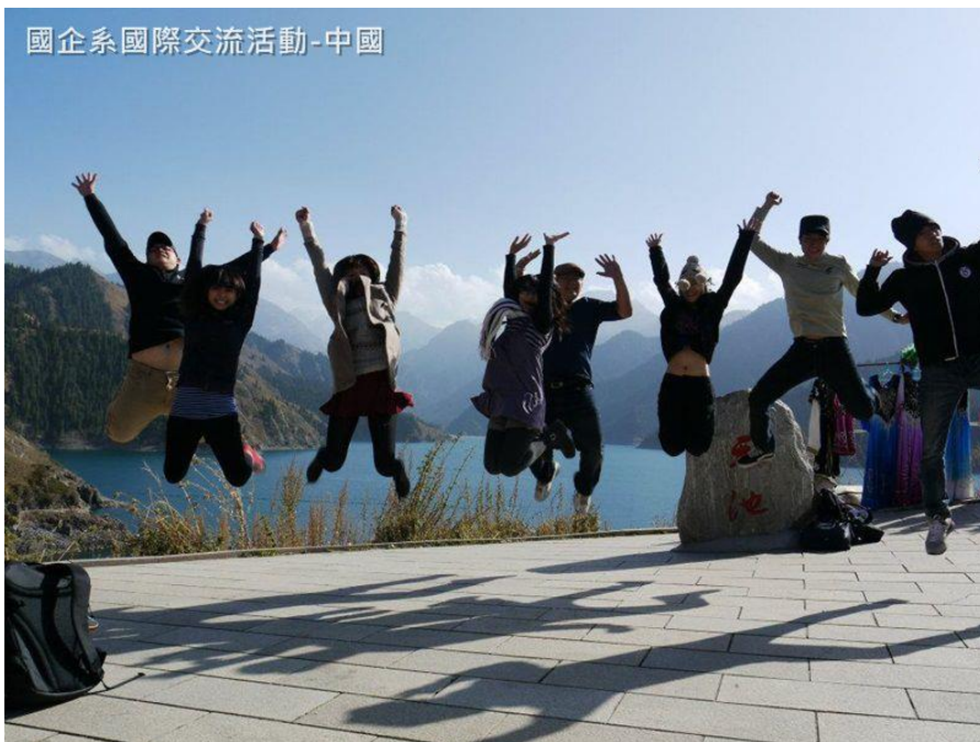
國企系國際交流活動-中國